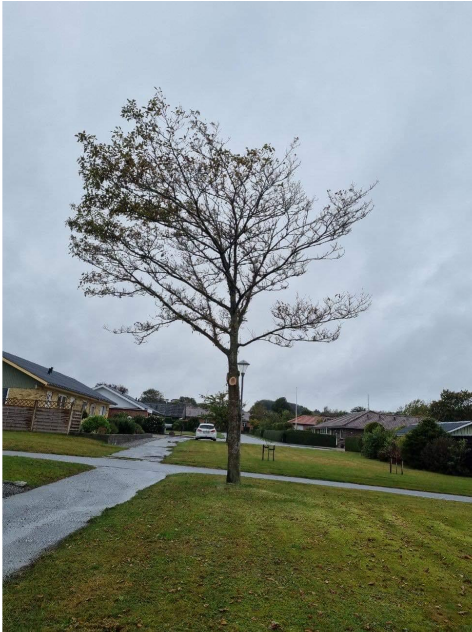
Billede 3: Beskæring af træ.