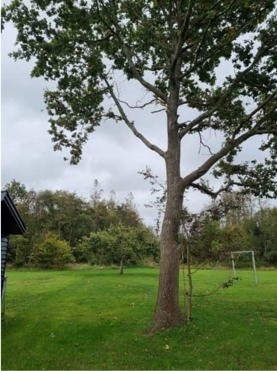
Billede 5: Beskæring af træ.