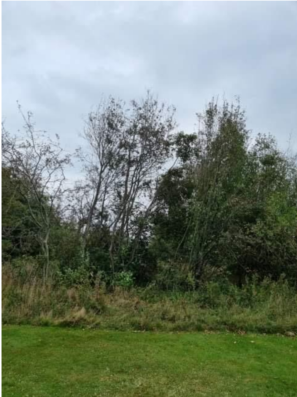
Billede 2: Beskæring af træer og buske.