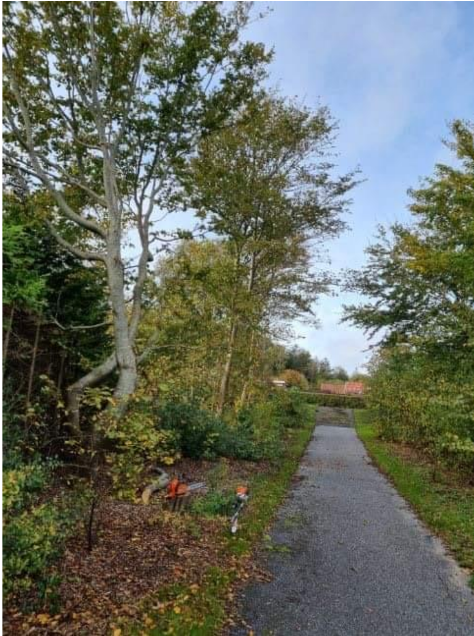
Billede 4: Beskæring af træer og buske.